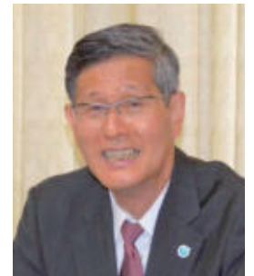
認定 NPO 全世代代表理事 尾身茂

新型コロナワクチンを接種する医師が不足している地域と先生のキャリアを繋ぐ事業です。是非ご登録ください。