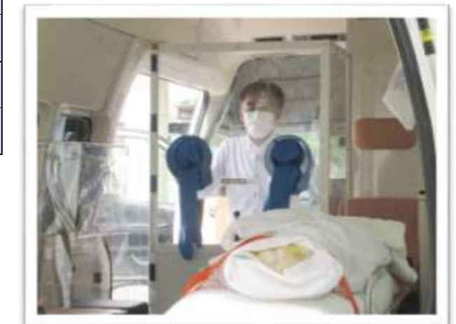
※救急車内での検体採取